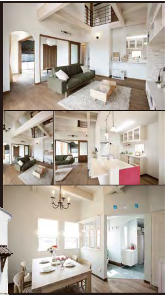
福島モデルハウス

火山灰の塗り壁と上質な無垢の床や建具の優しい風合いが住む人に心地よい安らぎを与える新しい「こづちのいえ」。