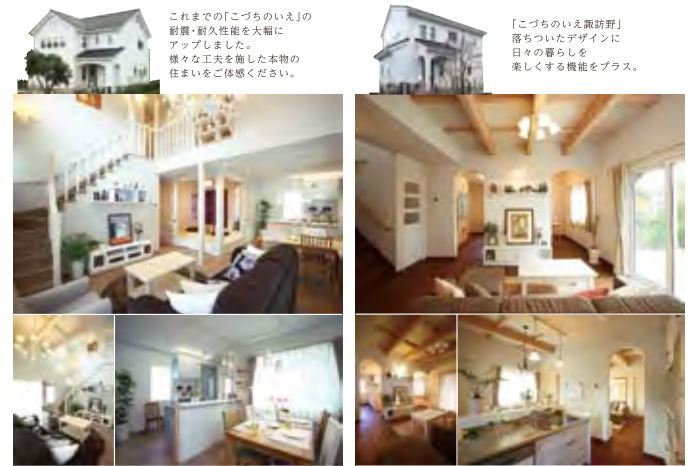
郡山モデルハウス