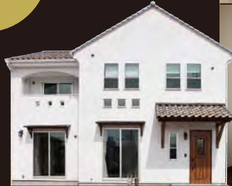
白河モデルハウス

火山灰の塗り壁と上質な無垢の床や建具の優しい風合いが住む人に心地よい安らぎを与える新しい「こづちのいえ」。